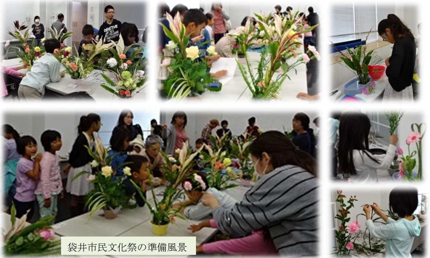
袋井市民文化祭の準備風景

活動内容 対象者：小学生、中学生、高校生 ・華道の心得、生花七カ条を身に付ける ・道具の手入れと取扱い方法、花材に対する基礎知識を学び身に付ける ・体験を通して創造力を高め、生きる力を育てる