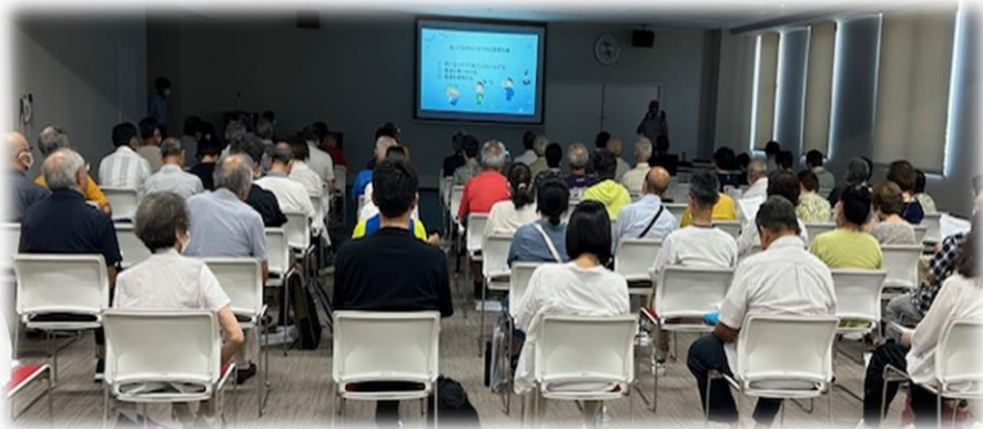
2024年7月28日(日)「防災講座」約80名受講 袋井市袋井危機管理センターで開催