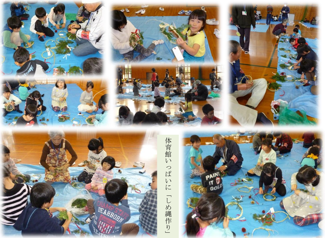
体育館いっばいに「しめ縄作り」

活動内容 ・地域の方々の協力により開催する ・年間 15 回、小学 1～6 年生の希望者対象に開催 ・昔遊び、輪投げ、料理、生け花、手品、グランドゴルフ 他 ・季節のイベント（七夕、クリスマス、しめ縄作り、節分、ひな祭り他）