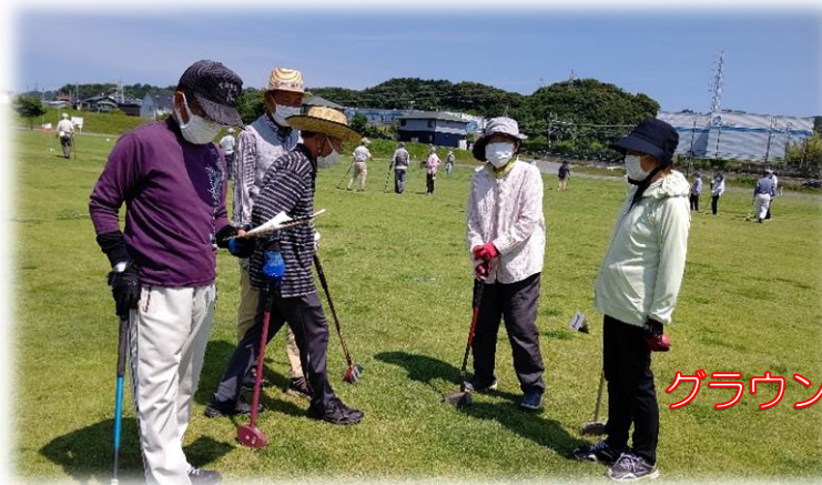
グラウンドゴルフ大会

活動内容 ・クラブ活動：運動や趣味の活動を通して生き甲斐、仲間作り ・講習会の開催：講師を招いて健康管理や活動内容の充実を図る