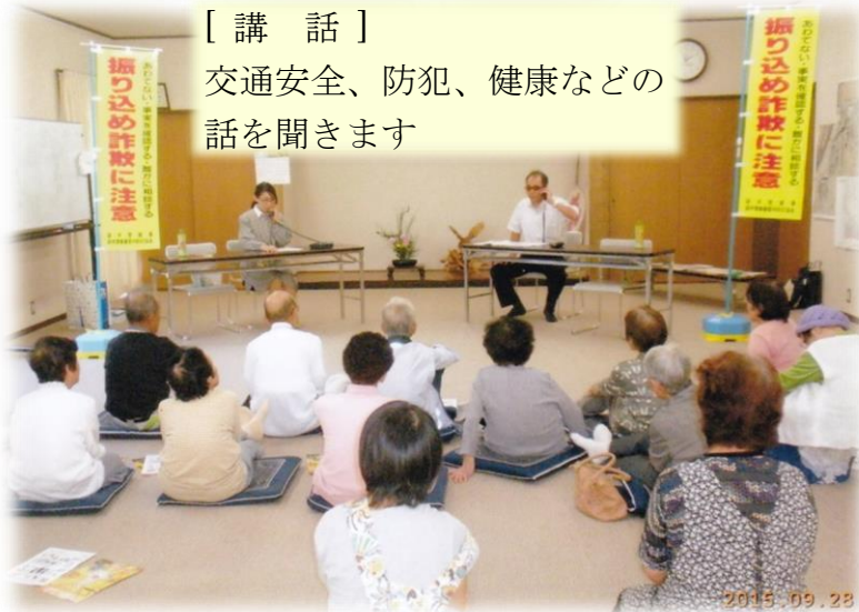
[ 講 話 ] 交通安全、防犯、健康などの話を聞きます