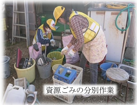
資源ごみの分別作業