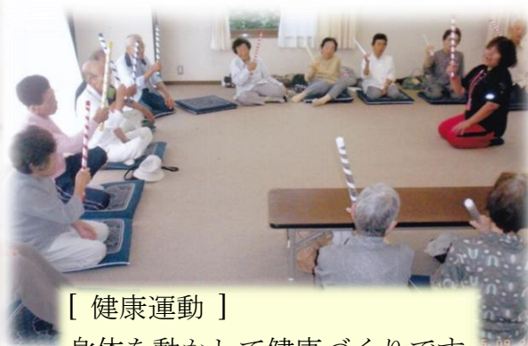
[ 健康運動 ] 身体を動かして健康づくりです