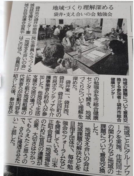
袋井中部地域包括支援センター 「地域支え合いの会」