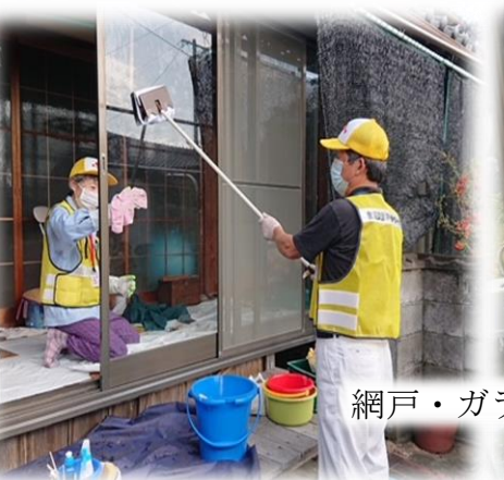
網戸・ガラス戸の掃除