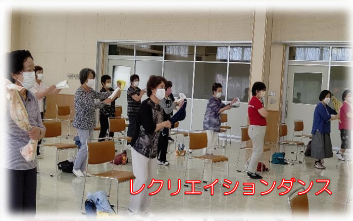
レクリエーションダンス