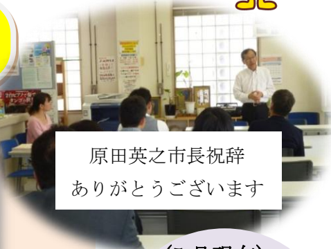
原田英之市長祝辞 ありがとうございます

袋井市内で活動する市民団体を冊子にまとめました。ご自由にご覧ください。貸出しもできます。ご希望の方は、スタッフにお申し出ください。